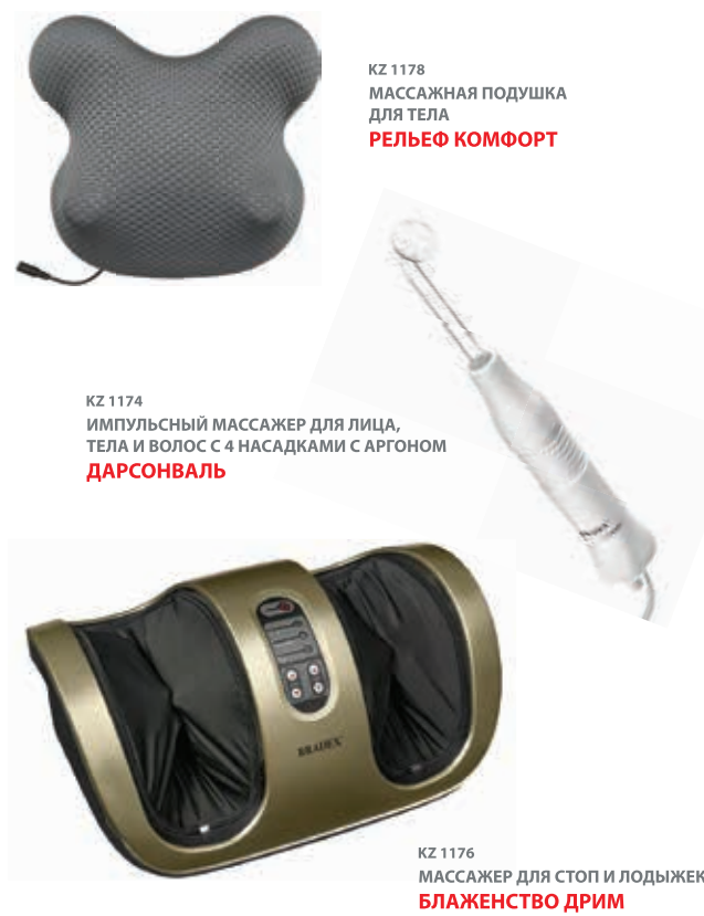
KZ 1178 МАССАЖНАЯ ПОДУШКА ДЛЯ ТЕЛА РЕЛЬЕФ КОМФОРТ