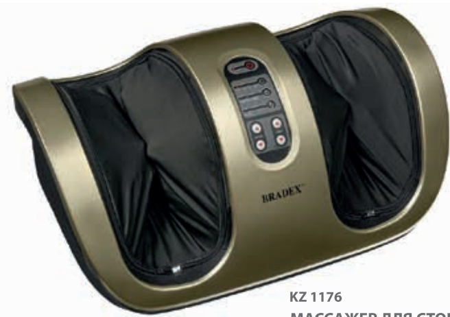
KZ 1176 МАССАЖЕР ДЛЯ СТОП И ЛОДЫЖЕК БЛАЖЕНСТВО ДРИМ

Произведено по заказу «BRADEX» ISRAEL. Trans East Metal Ltd, POB 9101, Haifa 31091, Israel. Tel: +972-4-8521824, fax: +972-3-7256059. www.bradex.il Импортер на территории РФ: ООО «Технологии здоровья», Российская Федерация, 117405, Москва, ул. Варшавское шоссе, д.145, корп. 8. Тел.: 8 (495) 647-09-59, 8 (495) 648-26-66, www.bradex.ru Импортер на территории Республики Беларусь: ООО «БРАДЕХ», 220019, г. Минск, ул. Монтанжиков, д. 9 комн. 34/4. УНП 192409754. Сайт: www.bradex.by. E-mail: info@bradex.by. Страна происхождения: Китай Изготовитель: Джецзян Нью Вижн Импорт энд Экспорт Кампань Лимитед, Адрес: Синьцзянь Роуд, 5, Индустриальная зона Бэйтанг, город Нинбо, КНР, 315708. Тел: +86-574-6560937, факс: +86-574-6560938, e-mail: zhejiangnewvision.china@gmail.com Международная торговая марка «BRADEX». Рег. №1419183 Израиль - Рег. №204012 Россия - Рег. №444287, №683532