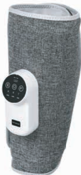
KZ 1429 МАССАЖЕР ЛИМФОДРЕНАЖНЫЙ для ИКР и ПРЕДПЛЕЧИЙ БЕСПРОВОДНОЙ