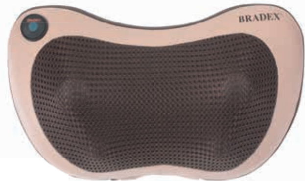
KZ 0573 МАССАЖНАЯ ПОДУШКА С ПОДОГРЕВОМ И РАЗМИНАЮЩИМ МАССАЖЕМ ШИАЦУ