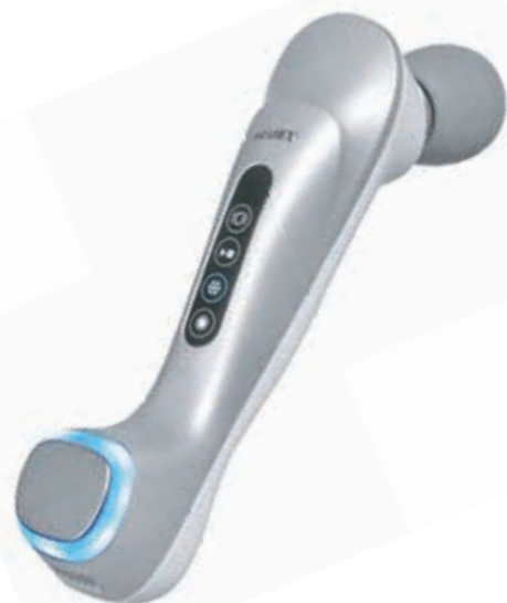
KZ 1422 МАССАЖЕР ВИБРАЦИОННЫЙ ДЛЯ ЛИЦА И ТЕЛА DAY JOY