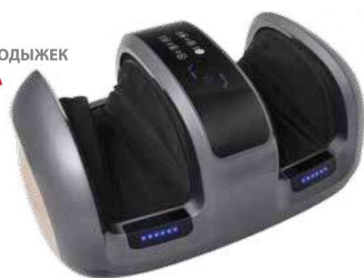
KZ 1180 МАССАЖЕР ДЛЯ НОГ СО СЪЕМНЫМИ ЛИМФОДРЕНАЖНЫМИ МАНЖЕТАМИ ВИВО