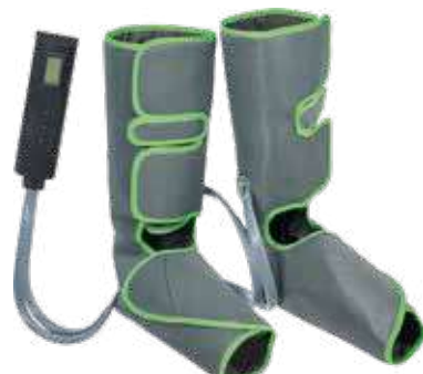
KZ 1166 КОМПРЕССИОННЫЙ ЛИМФОДРЕНАЖНЫЙ МАССАЖЕР ДЛЯ НОГ