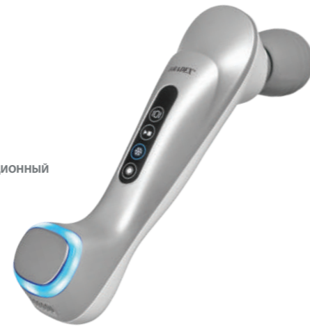
KZ 1422 МАССАЖЕР ВИБРАЦИОННЫЙ ДЛЯ ЛИЦА И ТЕЛА DAY JOY