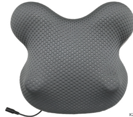
KZ 1178 МАССАЖНАЯ ПОДУШКА ДЛЯ ТЕЛА РЕЛЬЕФ КОМФОРТ

Храните в местах, недоступных для детей и животных