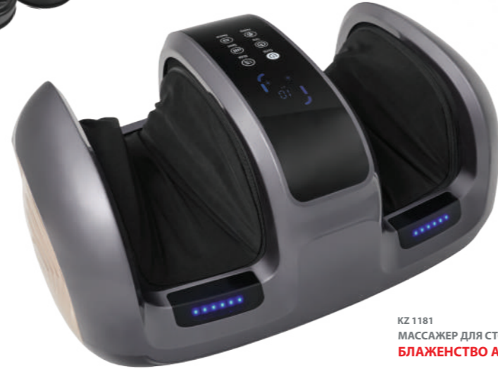
KZ 1181 МАССАЖЕР ДЛЯ СТОП И ЛОДЫЖЕК БЛАЖЕНСТВО АЛЬФА