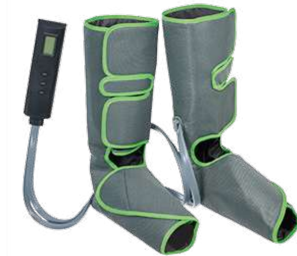
KZ 1166 КОМПРЕССИОННЫЙ ЛИМФОДРЕНАЖНЫЙ МАССАЖЕР ДЛЯ НОГ