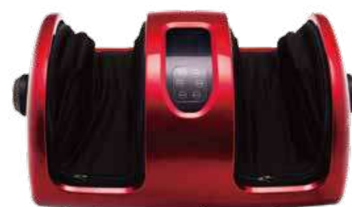
KZ 0562 МАССАЖЕР ДЛЯ СТОП И ЛОДЫЖЕК «БЛАЖЕНСТВО КОМПАКТ»