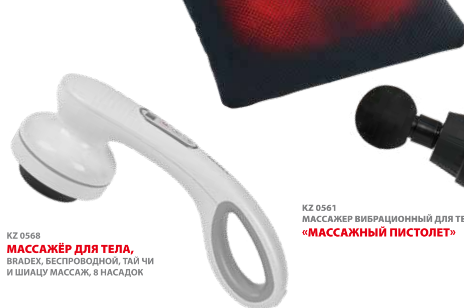
KZ 0568 МАССАЖЁР ДЛЯ ТЕЛА, BRADEX, БЕСПРОВОДНОЙ, ТАЙ ЧИ И ШИЦАЦУ МАССАЖ, 8 НАСАДОК