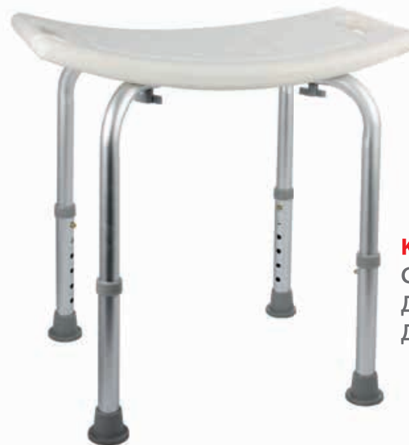
KZ 0935 СТУЛ-СИДЕНЬЕ СО СПИНКОЙ ДЛЯ КУПАНИЯ В ВАННОЙ И ДУШЕ