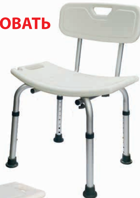
KZ 0536 СТУЛ-СИДЕНЬЕ ДЛЯ КУПАНИЯ В ВАННОЙ И ДУШЕ