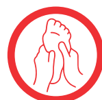
Эффект ручного массажа