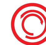
Работа роликов в 2х направлениях